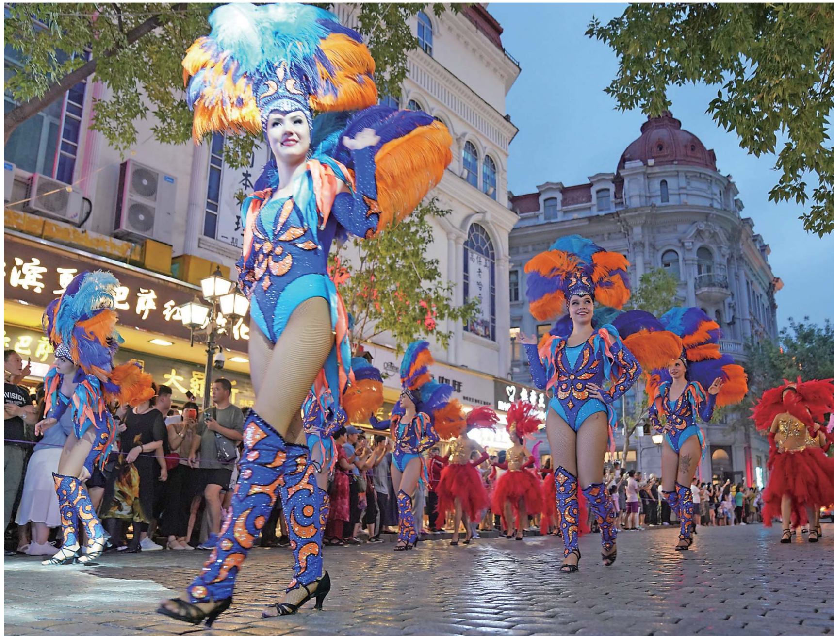
▲百年老街哈尔滨中央大街上的热舞表演队伍(7月27日摄)。