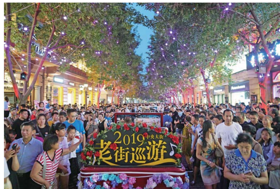
▲百年老街哈尔滨中央大街上的花车巡游引来市民游客围观(7月27日摄)。