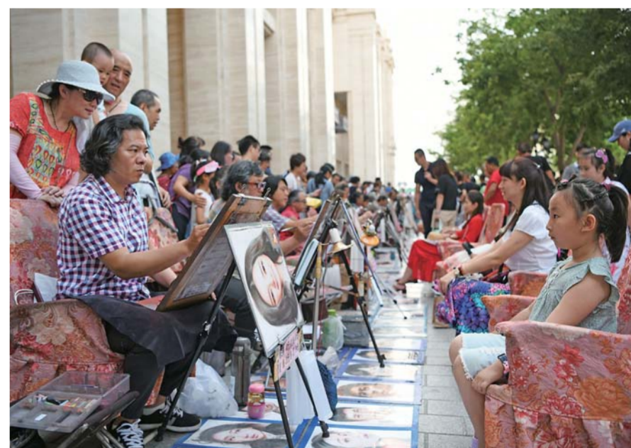
▲在中央大街上，画师正为一位小朋友画像(8月2日摄)。