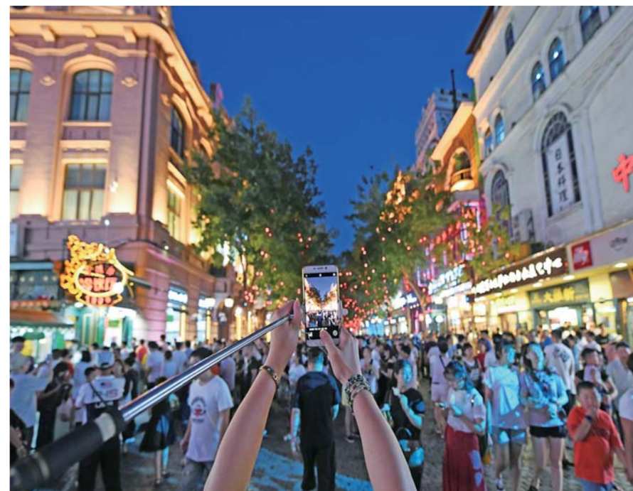
▲一位游客手机拍摄夜色中的中央大街(8月1日摄)。