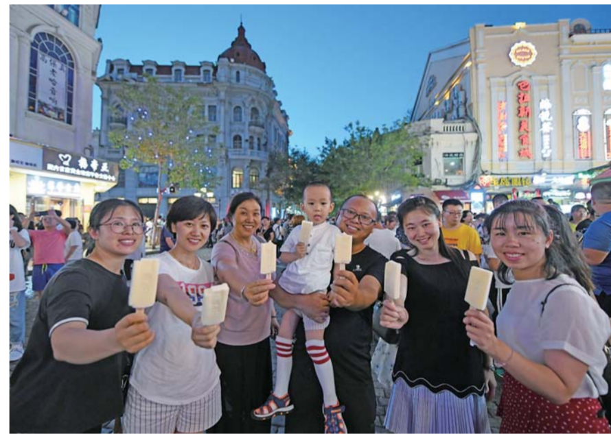
▲游客在中央大街上“举家”享用马迭尔冰棍(8月1日摄)。